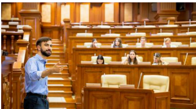
16.08 Vizita la Parlament a unui grup de tineri din cadrul organizației AIESEC în Chișinău.