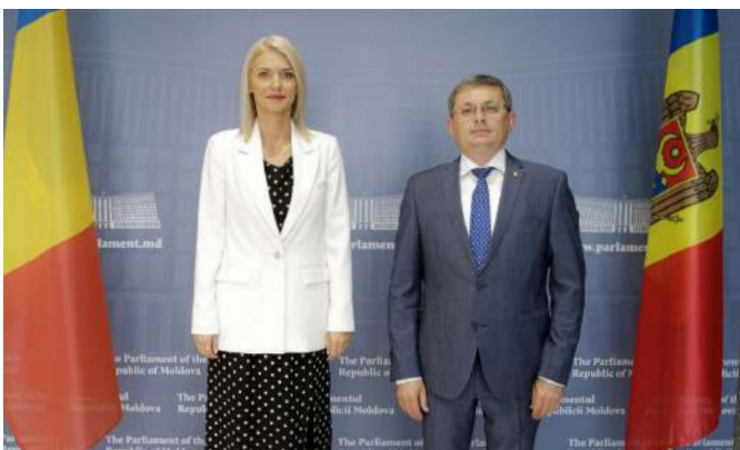
23.08 Președintele Parlamentului, Igor Grosu, a avut o întâlnire cu ministra Justiției a României, Alina-Ștefania Gorghiu, aflată într-o vizită la Chișinău.